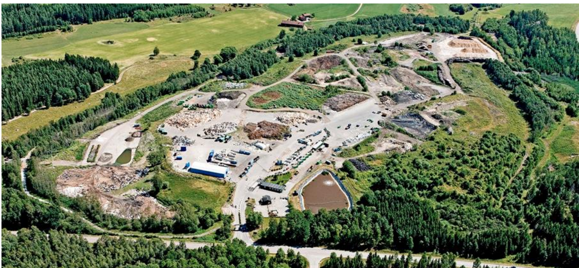
Figur 1, Drönarbild över Vika avfallsanläggning i Katrineholm